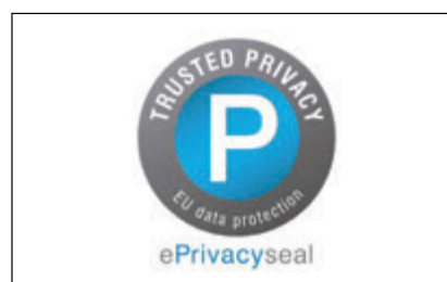
Το σύστημα πληροί τις ΑΠΑΙΤΗΣΕΙΣ ΠΡΟΣΤΑΣΙΑΣ ΔΕΔΟΜΕΝΩΝ της ePrivacyseal GmbH.