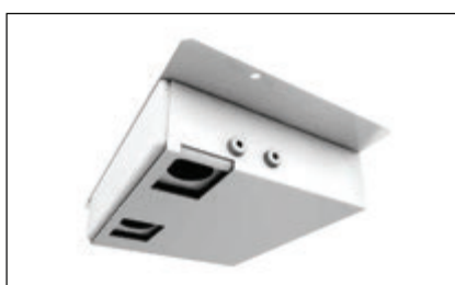
ΣΤΕΡΕΟΣΚΟΠΙΚΗ ΚΑΜΕΡΑ για αξιόπιστη μέτρηση κατά την είσοδο/έξοδο.

Ο μέγιστος αριθμός επιτρεπόμενων ατόμων εντός του καταστήματος έχει ξεπεραστεί – δεν επιτρέπεται η πρόσβαση.